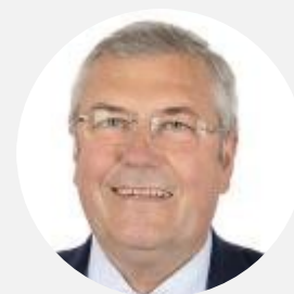
Rémy Pointereau Sénateur (LR) du Cher Rapporteur