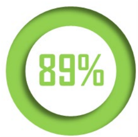
Part modale de la route

Avec 90 % du transport intérieur dans l'Hexagone, le mode routier domine le transport de marchandises dont il assure pratiquement toute la croissance depuis plusieurs décennies. Ses atouts sont sa fiabilité , sa flexibilité et sa qualité de service , creusant l'écart avec les modes massifiés ferroviaire et fluvial qui se sont vus progressivement marginalisés par la route : notre fret ferroviaire et fluvial est en effet deux fois moins développé que la moyenne européenne.