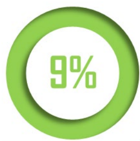
Part modale du fer