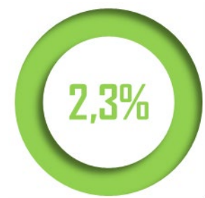
Part modale de la voie d'eau